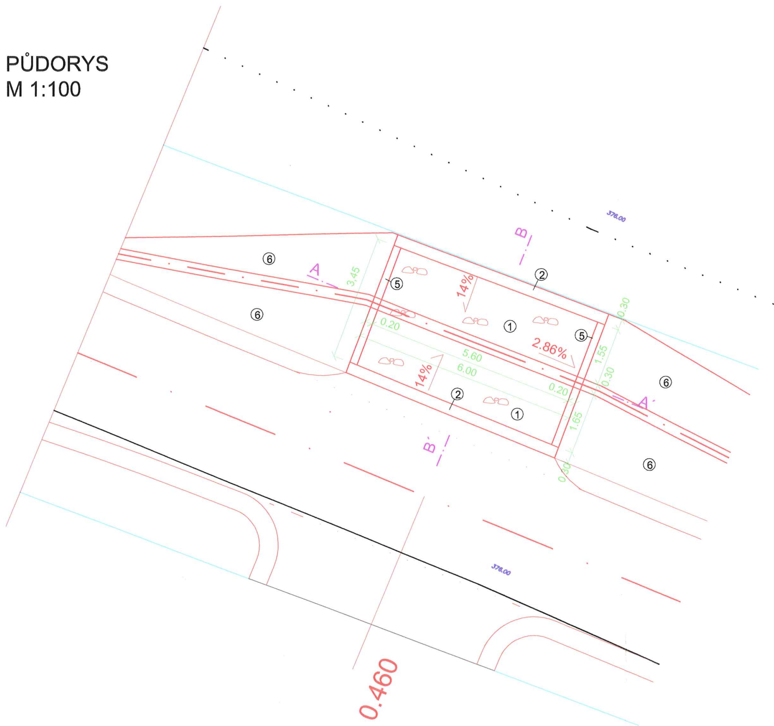
PŮDORYS M 1:100